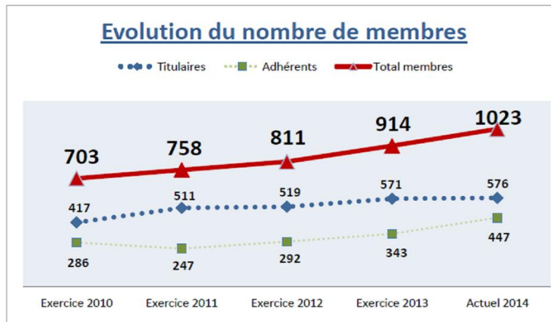
Figure 1: Evolution du nombre de membres de l'association EMDR-France depuis 2010