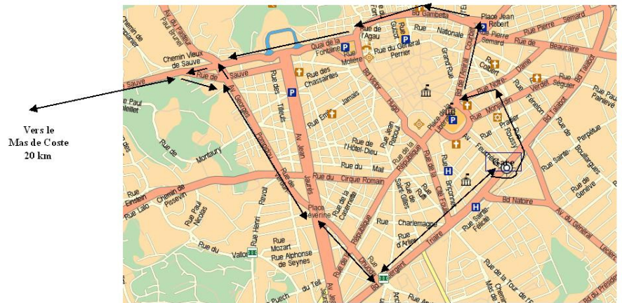
Plan vers la gare de Nîmes